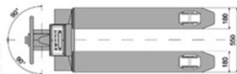
TPWX3GD: dimensions en mm.